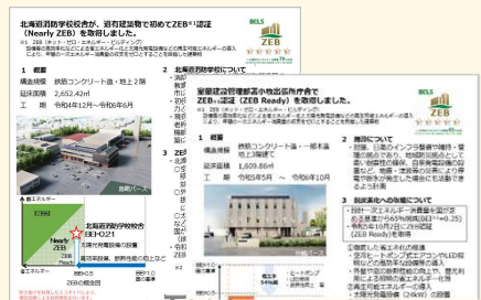
道有建築物におけるZEB事例

https://www.pref.hokkaido.lg.jp/kn/ksb/754.html