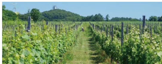
ナカザワヴィンヤード