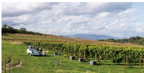
濱田ヴィンヤード