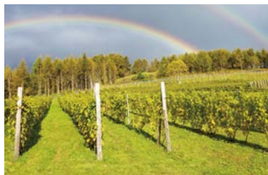
宮本ヴィンヤード