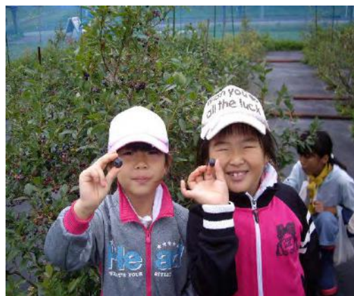
地域住民と生産者の交流会・勉強会