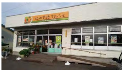
〈北の大地マルシェの全景〉