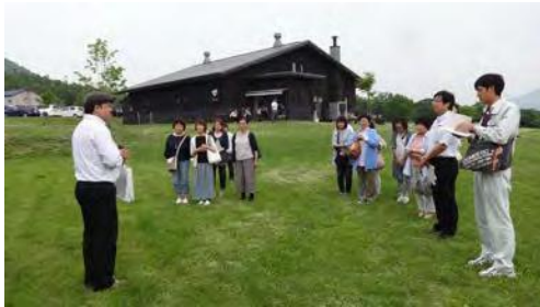
〈高橋牧場（ニセコ町）〉