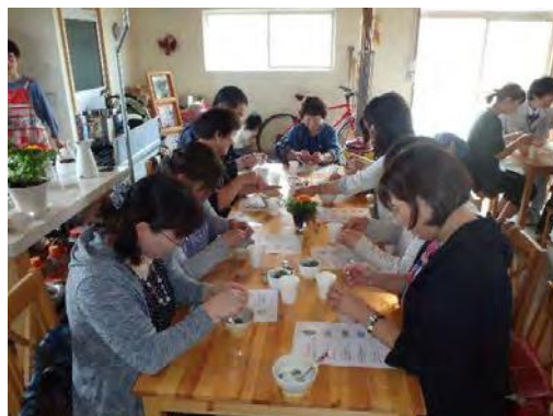
ハーブ・ガーデン（7月）