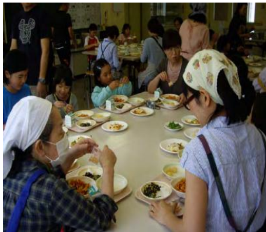
子供産地見学（宮後農園）