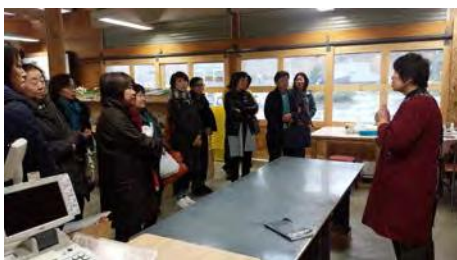
〈美瑛町の直売所の研修風景〉