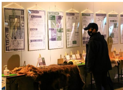
狩猟情報パネル展の様子