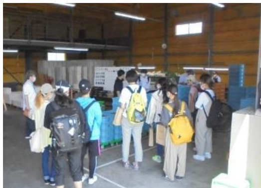
共同選果施設の視察