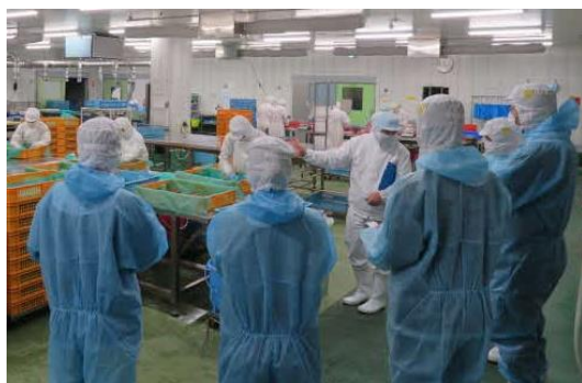
課題解決策提案のための調査（工場見学）