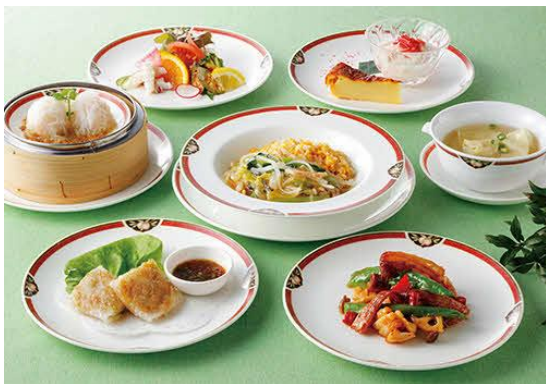
石狩管内の農水産物を使ったレストランメニュー