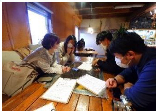
大学生の地域活動の様子

大学生が地域活動を通じて地域との関わりを持ち、地域の理解を深め、定住促進につなげることを目的とした、管内大学との連携による大学生の地域活動への支援や、石狩農業の魅力を発信する取組を行っています。