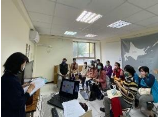
台湾での石狩セミナーの様子