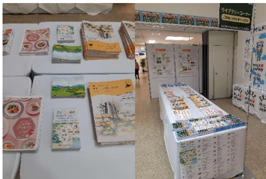
ミルク&amp;ナチュラルチーズフェアでのパンフレット配架状況

新型コロナウイルスの感染拡大に伴い、イベントの縮小や学乳の停止などにより、牛肉や牛乳・乳製品の需要の落ち込みが激しいことから、十勝農畜産物の需要喚起及び需要拡大に資する取組のため、各種イベントや消費拡大PRを実施しています。