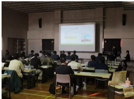
事例発表会の様子