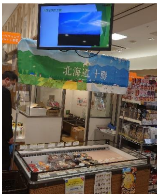
「とかちフェア in 東京」の様子

また、十勝の「食」の付加価値向上、ブランド化の取組、十勝製品のPR・販路拡大を併せて進める中で、十勝の認知度及び誘客推進のさらなる向上を図っています。