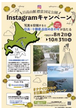
Instagramキャンペーンのチラシ

そこで、国立公園指定後の地域振興について、適正利用の気運醸成を図る必要があります。