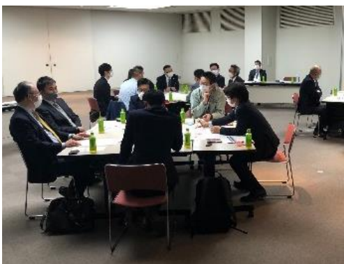
「交通旅行商品検討ワーキング」の様子