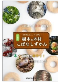
森林・林業体験モデルプログラム 「森の輪」PR冊子