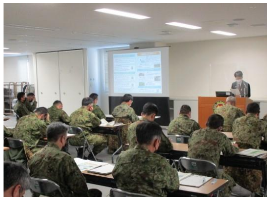
退職予定の自衛官向け研修の様子