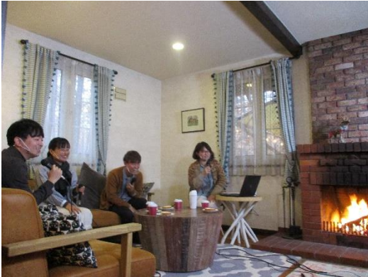
オンライン交流会の様子

十勝地域でも課題となっている人口減少問題対策のため、①若者の流出傾向が高いこと、②まちの魅力発信の必要性に関する意見が多いこと、に着目して「まちづくり」「ひとづくり」「しごとづくり」に視点をおき、地域住民のニーズや市町村等が抱える課題を把握し、具体的な対策を検討し、地方創生に向けた取組を推進しています。