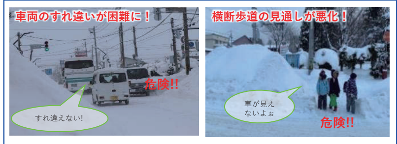
除排雪が滞った場合の道路利用者への影響