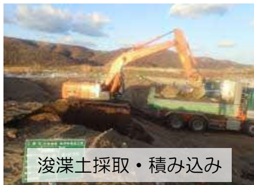
浚渫土採取・積み込み

【従来】直接工事費 15,260千円 ⇒ 【今回】13,280千円 (改善額 1,980千円 改善率 13%)