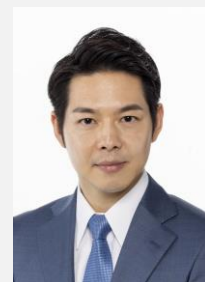
北海道知事 鈴木 直道